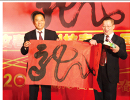
董事长方特等获奖获得者赠送宝井颁发奖品