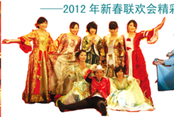
科技孵化员工表演《七个白雪公主和一个小矮人》