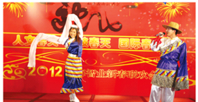
渤海博智管宇、时波表演歌舞《金玛》