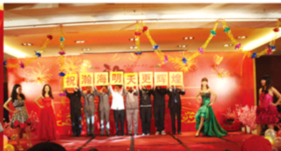
汉潮大成员表演情景剧《我们的一天》