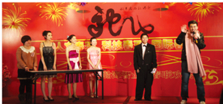
华海基业员工表演小品《非诚勿扰》