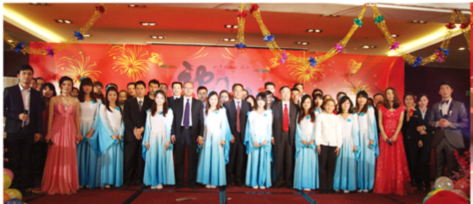
演出人员与集团领导合影留念