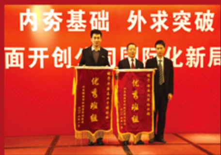
先进班组：华海基金中控班组 瀚海润泽物业部